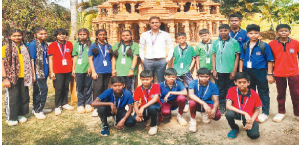
भ्रमण में एकलव्य विद्यालय के विद्यार्थी

मुंगेरी। पीएमश्री योजना के अंतर्गत विद्यार्थियों के सर्वांगीण विकास, व्यवहारिक ज्ञान तथा पर्यावरणीय एवं वैज्ञानिक समझ को सुदृढ़ करने के उद्देश्य से पीएमश्री एकलव्य आदर्श आवासीय विद्यालय बंधवा के विद्यार्थियों शैक्षणिक भ्रमण पर बिलासपुर स्थित प्रसिद्ध कानन पेंडारी जूलॉजिकल गार्डन तथा वंडर वर्ल्ड पार्क का भ्रमण कराया गया। भ्रमण के दौरान विद्यार्थियों ने कानन पेंडारी जूलॉजिकल गार्डन में विभिन्न वन्यजीवों, पक्षियों एवं जीव-जंतुओं को नजदीक से देखा तथा उनके प्राकृतिक आवास, संरक्षण एवं जीवन शैली के बारे में महत्वपूर्ण जानकारी प्राप्त की। शिक्षकों ने विद्यार्थियों को जैव विविधता, पर्यावरण संरक्षण तथा