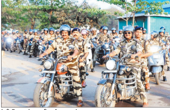
रैली निकालते हुए सीआईएसएफ के जवान।