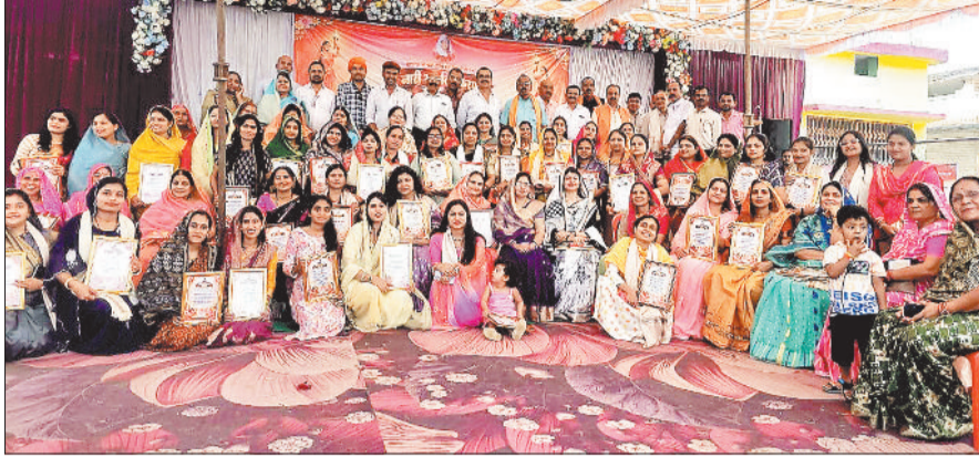
कार्यक्रम में उपस्थित क्षत्रिय समाज की महिलाएं।