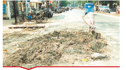
मंगला रोड की सड़क जर्जर।

[ बिल्हा | मस्तूरी | तखतपुर | मुंगेली | कोटा | लोरनी | सरगांव | पेंड़ा | बेलतरा | रतनपुर | पथरिया ]