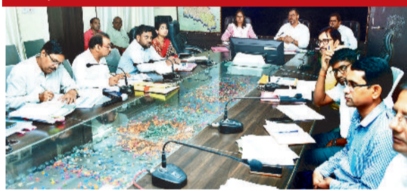
शिक्षा विभाग की बैठक लेते कलेक्टर

जाएँ, ताकि स्कूलों में विद्यार्थियों को बेहतर सुविधाएं उपलब्ध हो सकें। कलेक्टर ने कहा कि शिक्षा की गुणवत्ता में सुधार और विद्यार्थियों को बेहतर शैक्षणिक वातावरण उपलब्ध कराने के लिए सभी अधिकारी समन्वय के साथ कार्य करें और योजनाओं के क्रियान्वयन में तेजी लाएं। बैठक में कलेक्टर ने पीएम श्री योजना के अंतर्गत सेचुरेशन प्वाइंट की प्रगति की